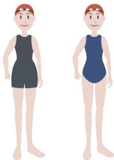
Figura 2 – Equipamentos de competi o para as nadadoras infantis.